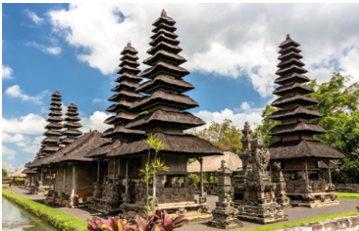
▲ Świątynia Taman Ayun

Świątynię, której nazwa oznacza w dosłownym tłumaczeniu „piękny ogród”, otaczają zadbane tereny zielone z licznymi stawami, a sam kompleks okala fosa. Taman Ayun znane jest również jako świątynia rodzinna ( Pura Kawitan ), ponieważ została wybudowana jako sanktuarium specjalnego hołdu i czci dla przodków rodziny pierwszego budowniczego, króla Mengwi. Po wejściu