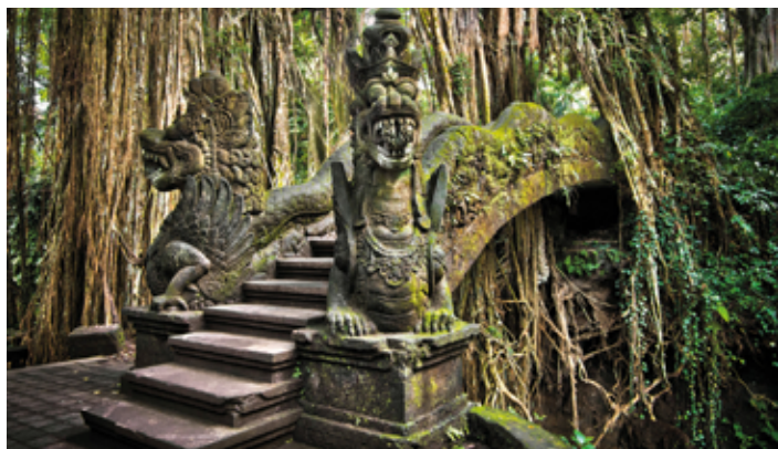
▲ W Małpim Lesie

Ubud jest w chwili obecnej niekwestionowaną stolicą sztuki, będącą dla Bali tym, czym dla stołecznej Jawy jest Yogyakarta. Pierwsza fala rozwoju sztuki, jaka wyniosła Ubud do dzisiejszej rangi, miała miejsce jeszcze przed II wojną światową. W latach 30. swój dom i pracownię założył tutaj znany niemiecki malarz i muzykolog Walter Spies. Z jego inspiracji,