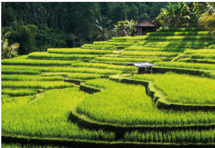
▲ Pola ryżowe w Jatiluwih

do świątyni Taman Ayun, w wiosce Wanasari przy ulicy Batukaru. Podczas zwiedzania można podpatrzeć cały cykl życia tych owadów, od kokonu poprzez wyklucie się z niego aż po dorosłe fruwające osobniki, oraz potrzymać na rękę nie tylko motyle, ale i modliszki, chrząszcze rohatyrcowate oraz ćmy.